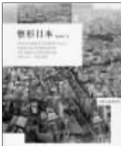
《整形日本》 [香港]汤祯兆 山东人民出版社 2008年1月