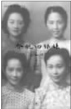
《合肥四姐妹》 [美]金安平 三联书店 2008年1月